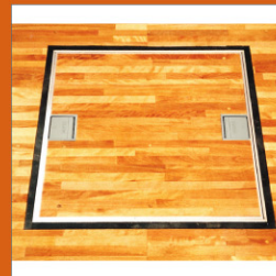
体育館用 床点検口 New ..... 307-308