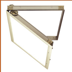
天井点検口 New ..... 286-293