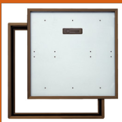
床点検口 New ..... 296-306