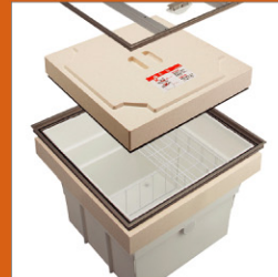
床下収納庫 New ..... 300,306