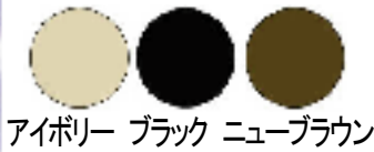
アイボリー ブラック ニューブラウン

ダンパー付と無いものの2種類が有り、ステンレス製粉体塗装なので、保守も容易です。厨房の換気扇外部用と、浴室や便所等の外壁の換気口外部用を揃えています。換気フードはデザインに合わせカラー3色よりお選び下さい。ダンパー(FD)付もあります。