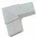
コーナージョイント ■ 出隅・入隅兼用 ■ 4寸勾配用