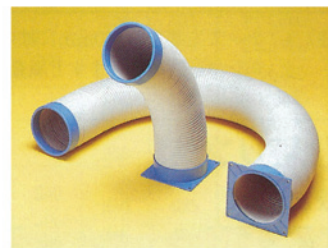
吹出ホースセット